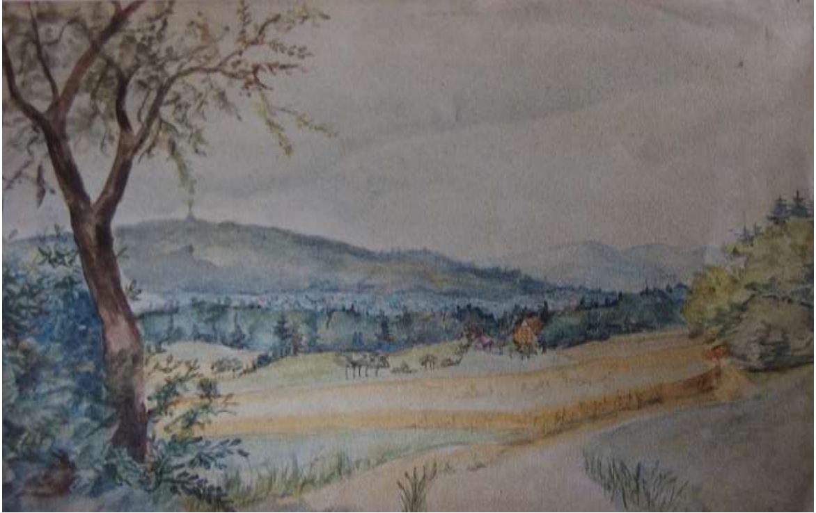
Sommerliche Landschaft bei Hornoldendorf / Bruno Wittenstein