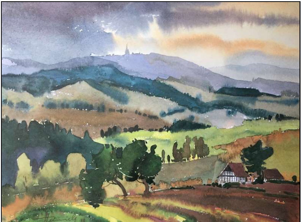
Wolfgang Heinrich / Aquarell