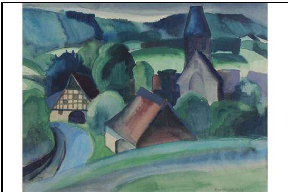
Eduard Herterich ? / Vermutet soll es Heiligenkirchen sein.