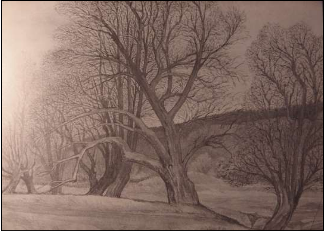
Weiden an der Berlebecke / Aquarell 1980 / Hans Jähne