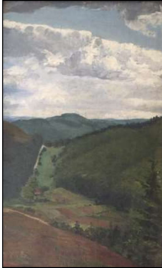
Das Haus Wendt / Heute Culturcafe