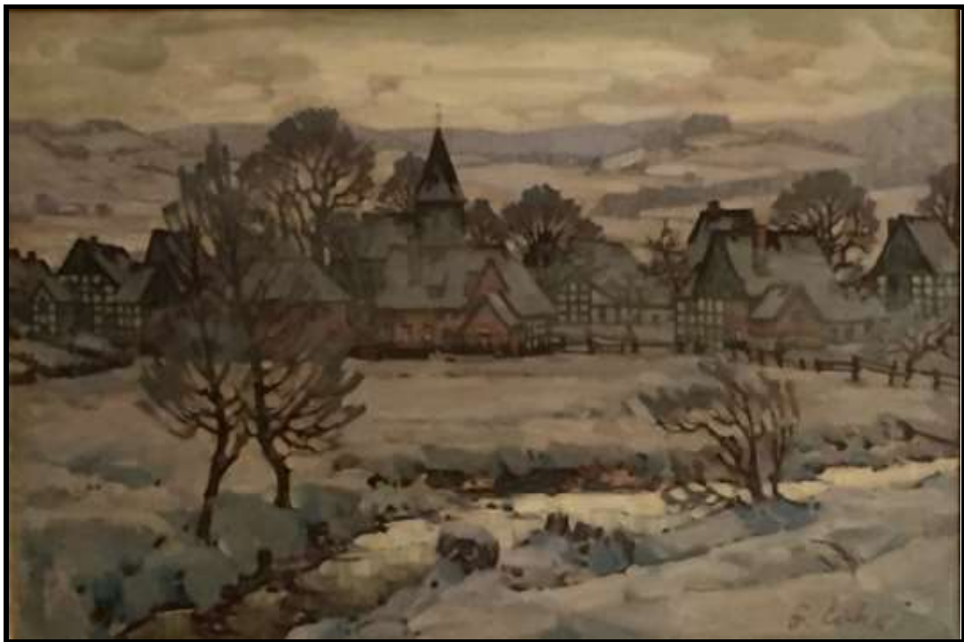
Laut Gutachten des Besitzers soll es Heiligenkirchen und nicht Bad Meinberg sein. / Friedrich Eicke