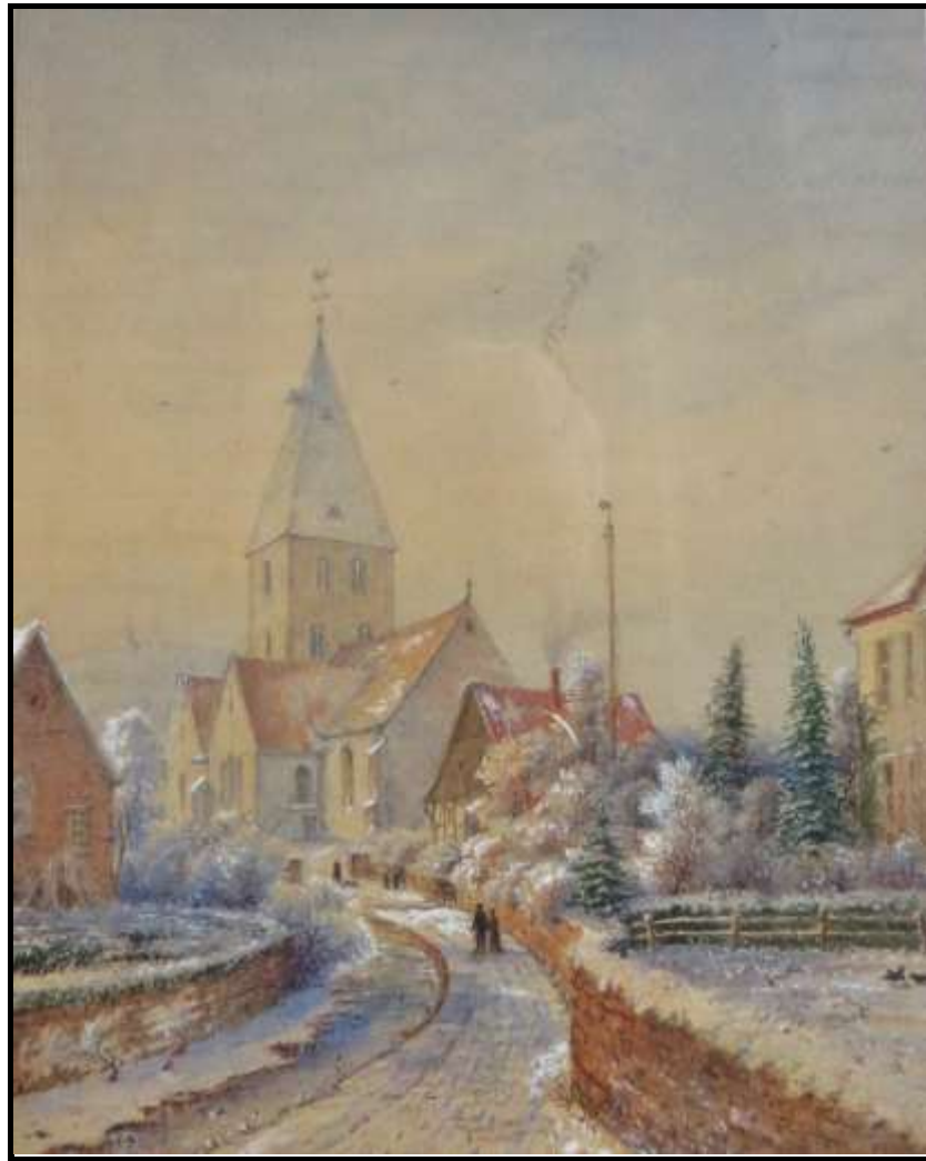
Heiligenkirchen im Winter / Emil Zeiss