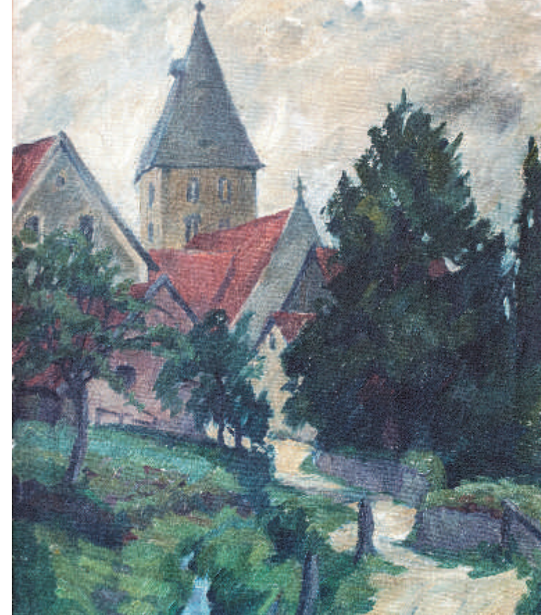
Ölgemälde, Anna Piderit um 1920

https://www.facebook.com/Heiligenkirchen